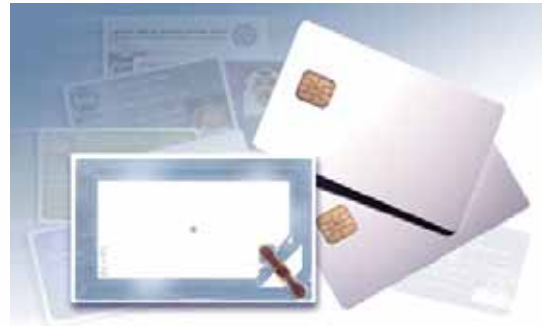
بطاقة ذكية عن بعد

توفر البطاقات الذكية مرونة أكثر وخصوصية للاستخدام اليومي للمسافرين كما أنها توفر الراحة والسرعة الفائقة في تطبيقات الدفع إذا ما قورنت مع تكنولوجيا الاتصال عن بعد. إنها تقدم أفضل الحلول الممكنة للقضايا الأمنية والشخصية عند استخدامها في مجالات البصمة مثل تطبيق الجواز الإلكتروني.