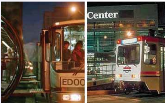
التنقل عبر الحافلات والقطارات